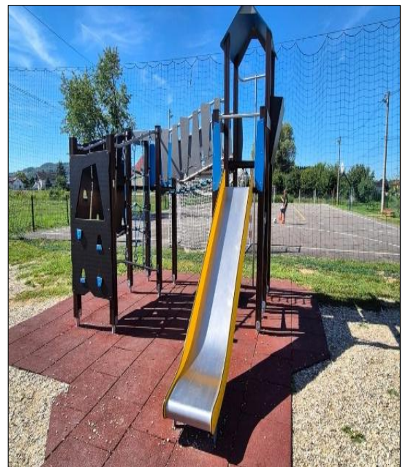
Uređeni dijelovi PŠ Farkaševac