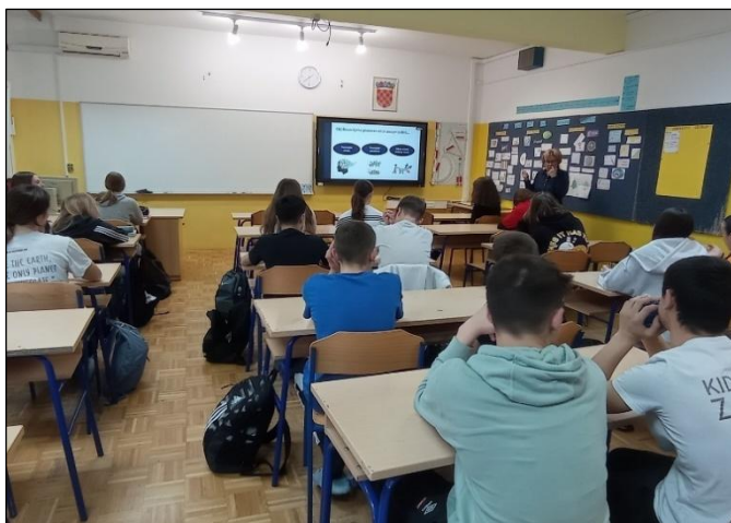
Slika 6: Štedopis

Radionice su učenicima ponudile razumijevanja novčarstva te osvijestile potrebu štednje i razumnog korištenja novcem.