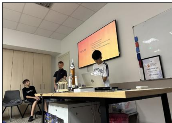
Slika 9: Određivanje geografske širine

Učenici su također pokazali zavidno znanje i vještine prezentiranja, napravili istraživanja, napisali izvješća u obliku znanstvenog rada i izradili prezentacije. Nakon realizacije projekta učenici su kompetentno upotrijebili stečena znanja, vještine i stavove te sagledali važnost prirodoslovlja kao znanstvenog područja u tehnološkom razvoju ljudskog društva. Usvojili su osnove metodologije znanstvenog istraživanja, od postavljanja pretpostavke do formiranja zaključaka, uz pridržavanje etičkih načela. Navedena istraživanja predstavili su drugim učenicima OŠ Bogumila Tonija na satovima informatike, geografije i prirode, na državnom natjecanju u Petrijevcima te građanstvu u sklopu projekta „Samoborci promatraju svemir“.