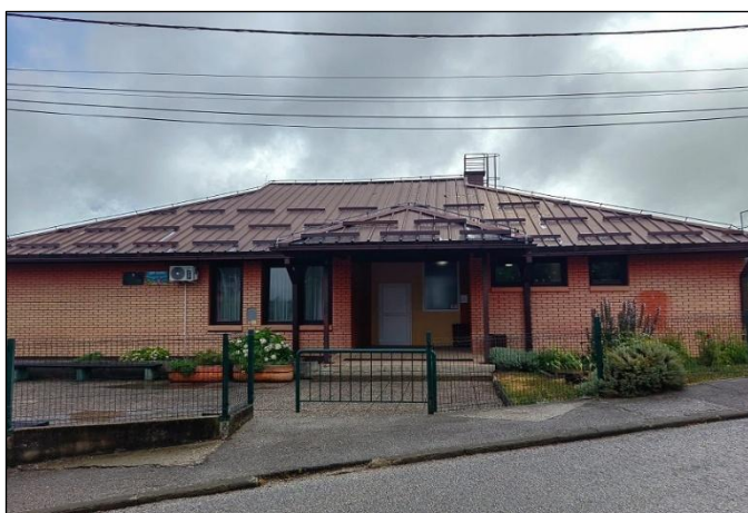
Slika 2: Područna škola Mirnovec

Područnu školu Mirnovec protekle je školske godine pohađalo 62 učenika raspoređenih u četiri razreda. S njihovim učiteljicama - Vesnom Bašić, Višnjom Fresl, Loretom Librić i Majom Šikić - svakodnevno su učili kroz razne aktivnosti, igru i druženje pritom brinući o okolišu svoje škole. Mirnovečki mališani tijekom godine obilježili su nekoliko važnih datuma i događaja u kojima su sudjelovali svi ili dio učenika i učiteljica. Najznačajniji događaj bio je svečani doček prvašića u rujnu koji je obogaćen igrokazom i pjesmom.