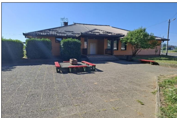
Slika 3: PŠ Farkaševac

Osim aktivnosti učitelja i učenika PŠ Farkaševac, tijekom drugog polugodišta izvođeni su radovi oko uređenja okoliša škole. Postavljena je ograda oko cijelog prostora škole, preuređena vanjska učionica, školsko je igralište osvježeno novim asfaltom i crtama te su postavljena igrala za djecu.