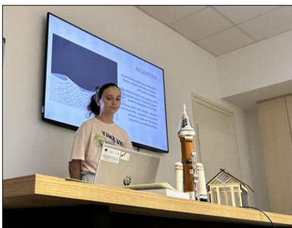
Slika 10: Mjesečevi krateri