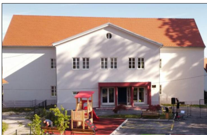
Slika 4: Škola u Langovoj

Druga godina školovanja za naše učenike bila je puna učenja, rasta, igara i zajedničkih uspjeha. Tijekom godine sudjelovali smo u mnogim organiziranim odgojno-obrazovnim aktivnostima, radionicama, projektima i izvanučioničkoj nastavi kroz koje smo dodatno obogatili učenje te razvijali kreativnost, motoriku i timski duh. Posebno su nas veselili nastupi koje smo s ponosom izveli pred roditeljima i školskim prijateljima.