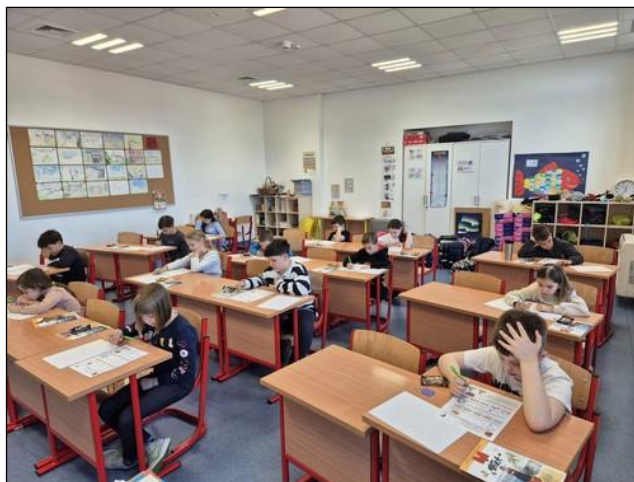
Slika 5: Klokan bez granica

Međunarodno matematičko natjecanje „Klokan bez granica“ koje organizira međunarodna udruga „Klokan bez granica“, koja okuplja predstavnike više od 80 svjetskih država, održano je u našoj školi u četvrtak, 20. ožujka 2025. Cilj je toga natjecanja popularizirati matematiku i prirodne znanosti te motivirati učenike da se bave matematikom izvan redovitih školskih programa. U organizaciji natjecanja sudjelovali su učitelji razredne nastave te svi učitelji matematike naše škole. Na tom su natjecanju u našoj školi sudjelovala 123 učenika u kategorijama Pčelice (2. razred), Leptiri (3. razred), Ecolier (4. i 5. razred), Benjamin (6. i 7. razred) te Cadet (8. razred). U 10% najboljih plasiralo se ukupno 20 učenika koji su ujedno i nagrađeni. Broj nagrađenih učenika po kategorijama je: Pčelice - 6 učenika, Leptiri - 5 učenika, Ecolier - 6 učenika i Benjamin - 3 učenika.