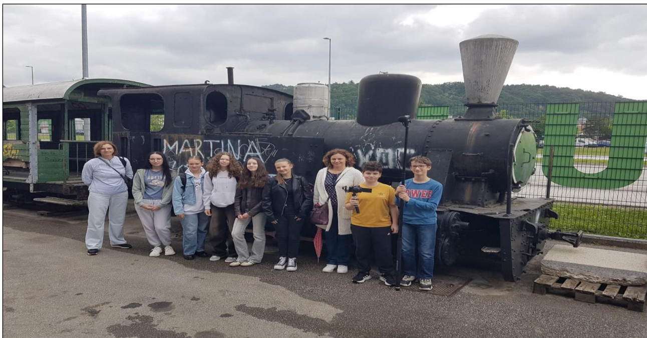
Slika 8: Ispred Samoborčeka

https://youtu.be/XxN9ZQv2UPg?si=sOzhGhHDY_dpdkk7