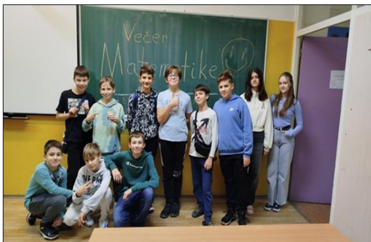
Slika 7: Večer matematike

Projekt Večer matematike provodi se u organizaciji Hrvatskog matematičkog društva, a predstavlja skup interaktivnih radionica u kojima sudjeluju učenici i njihove obitelji te učitelji, a koje kod učenika potiču izgradnju pozitivnog stava prema matematici. Ove se godine Večer matematike održala u našoj školi u četvrtak, 5. prosinca 2025. godine za sve učenike od prvog do osmog razreda. U organizaciji su sudjelovali učitelji razredne nastave te svi učitelji matematike naše škole. Svi su se sudionici i ove godine dobro zabavili!